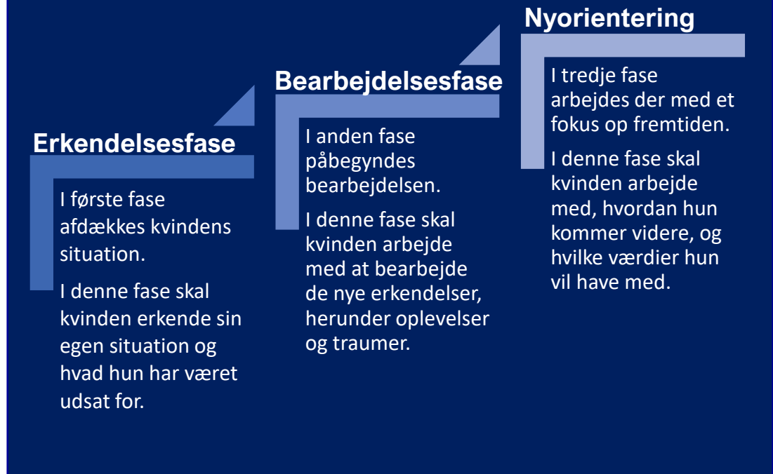
Figur 2: De tre faser i Sig det til nogen

På de følgende sider præsenteres de tre faser, samt de elementer der benyttes i den pågældende fase, til at sikre at kvinden kommer igennem fasen og opnår det bedste udbytte. Slutteligt opsummeres der på udbyttet af de forskellige faser i SDTN.